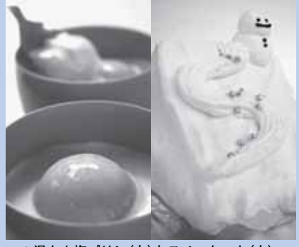
▲温たま塩プリン(左)とスノーケーキ(右)。各350円

舌の上でとろける温たま塩プリンやチーズを隠し味に使ったスノーケーキなど、定山溪でしか味わえないスイーツを販売します。