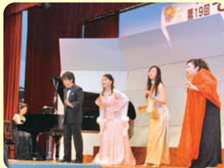
▲ゲストの「札幌室内歌劇場」はアンコールも含めて8曲を披露