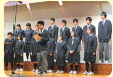
▲初参加の「札幌高等養護学校」 とても素晴らしい合唱でした