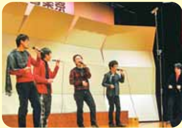
▲アカベラグループの「ケンタウロス」