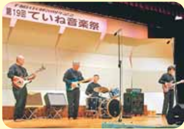
▲おじさんバンド 「ザ・ブラックベンチャーズ」

会場にいた約400人の観客からは寒さを吹き飛ばすほどの熱い拍手が寄せられ、合計23組が奏でる美しいメロディーを楽しんでいました。