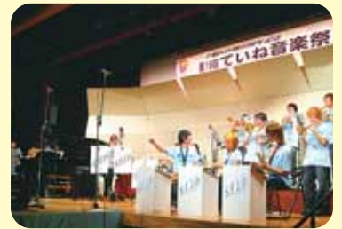
▲最後は「北海道工業大学 サニーフィールズ ジャズ オーケストラ」

詳細 手稲区区制20周年記念事業実行委員会事務局：地域振興課地域活動担当 ☎ 681-2400 (内線256)