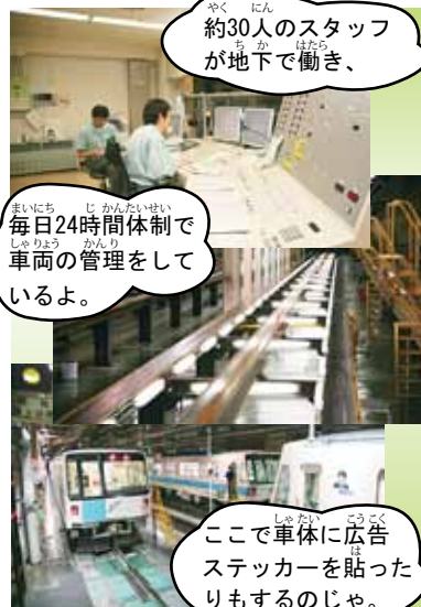
約30人のスタッフが が地下で働き、

これは地下鉄の 整備工場じゃよ。 広さは札幌ドームの 約半分。さらにこの 下を地下鉄東西線が 走っておるのじゃ。