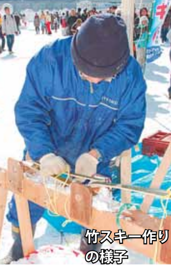
竹スキー作り の様子