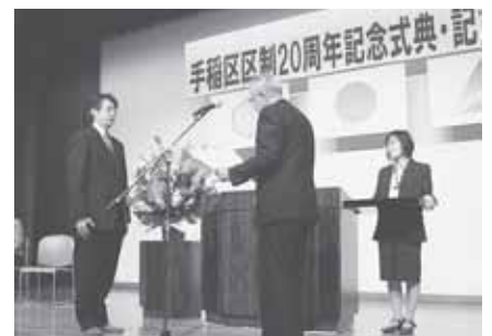
▲協賛いただいた団体への感謝状贈呈式

本事業の趣旨にご理解・ご賛同いただいた、個人、町内会、企業など合わせて168件に上る多大なご協賛をいただきました。