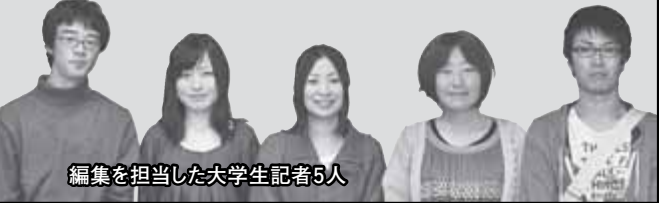
編集を担当した大学生記者5人

今月の特集は「西区PR隊大学生記者」が編集を行い、取材先の選定から、実際の取材、校正までの作業を行いました。「西区PR隊大学生記者」とは、市内の大学生が西区役所の記者となり、地域の取材や区の広報活動を行うもので、今年8月に結成されました。