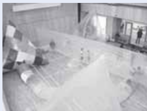
▲シーバルク (ビニールで作った大きな部屋やトンネル)