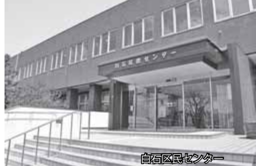
白石区民センター

コミュニティ施設「区民センター」「地区センター」をご存じですか。白石区には「白石区民センター」と「北白石」「白石東」「菊水元町」の3つの地区センターがあり、さまざまな活動に利用いただけます。