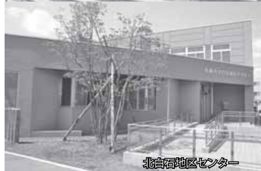
北白石地区センター