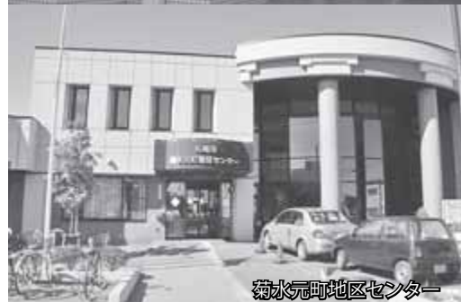
菊水元町地区センター