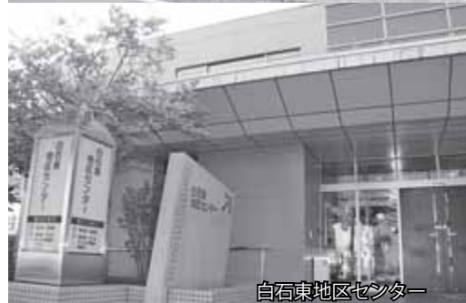
白石東地区センター