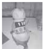
▲防火服型ペット服