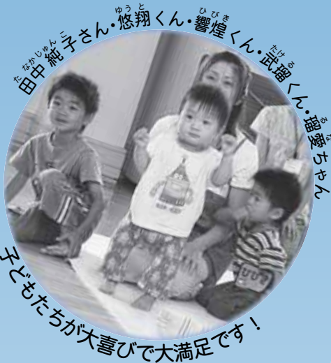
子どもたちが大喜びで大満足です!