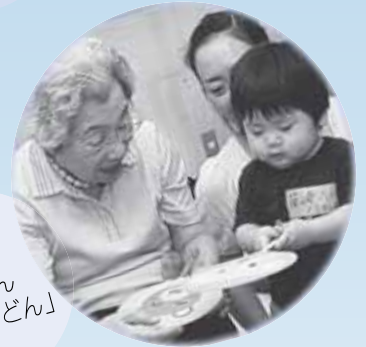
絵合わせ じゃんけん 「どどんがどん」