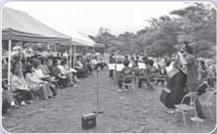
▲南沢ラベンダーまつり