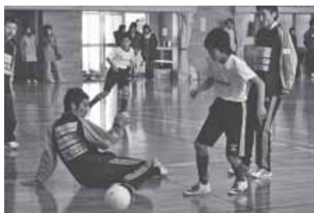
▲今年1月に行われた真駒内南小学校でのフットサル教室

室内で行う5人制のミニサッカーのようなもの。コートが狭いため点が入りやすく、スピーディーな試合展開が楽しめます。競技人口もここ数年で急増しています。特に雪の多い北海道では、外でサッカーができない冬期間のトレーニングの一環としても行われているため、日本で最も早く普及した地域といわれており、競技人口は都道府県で最多。全国大会では常に上位に入るなど、フットサルが盛んな地域です。