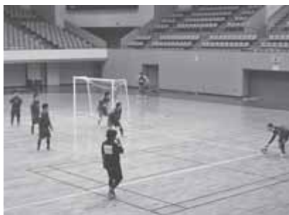
▲札幌での初戦が行われる同アリーナ。練習会場にもなっています

コンサドーレ札幌、北海道日本ハムファイターズ、レラカムイ北海道に続き、国内トップリーグに参入した「エスポラーダ北海道」。フットサルの全国リーグ（Fリーグ）に今年から参入し、8月22日（土）翌年2月28日（日）の間、各地で熱戦が繰り広げられます。札幌での記念すべき初戦は、9月21日（祝）に、真駒内セキスイハイムアイスアリーナで行われます。