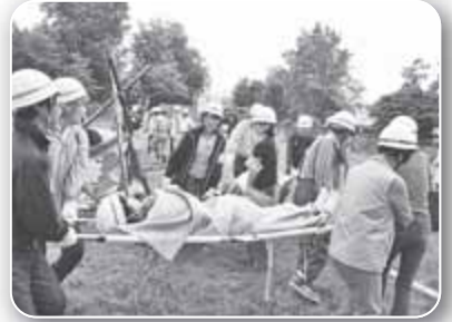
▲助け合いが大きな力に！

チェーンソーの機材操作訓練や担架での救出搬送訓練、消防ポンプを使った放水訓練など、本番さながらの訓練が展開されました。