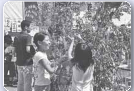
▲すみかわ七夕まつり