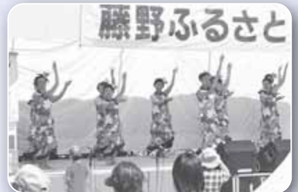
▲藤野ふるさとまつり