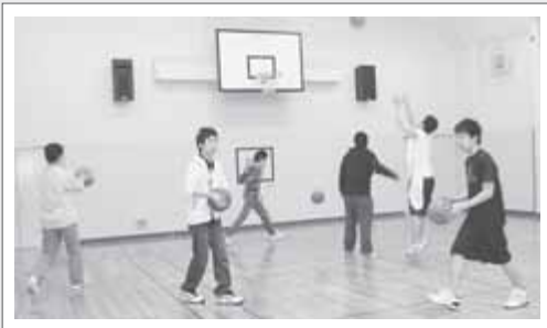
夜間利用を使ってみんなで楽しく バスケットボール 「ナイス シュート！」