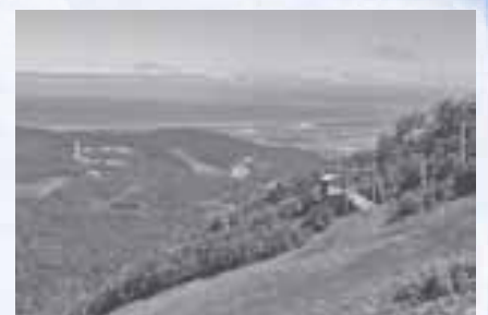
▲手稲山から石狩湾を望む