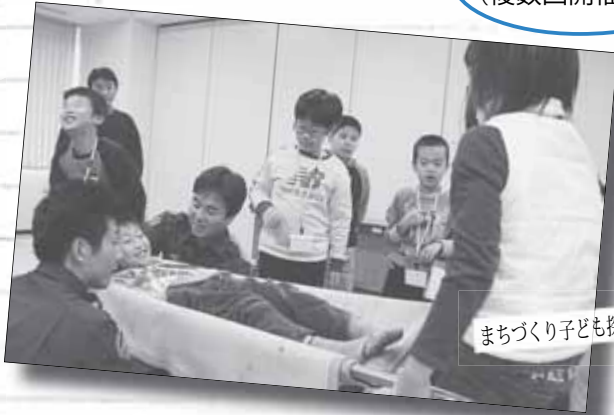
まちづくり子ども探偵団