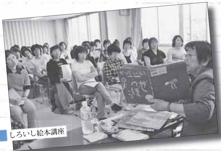
しろいし絵本講座