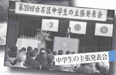
中学生の主張発表会