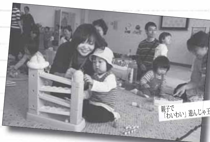
親子で「わいわい」遊んじゃ王国