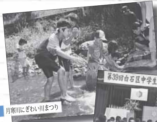
月寒川にぎわい川まつり