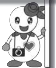
マスコットキャラクター「しろっぴー」