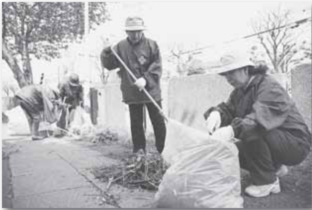
日赤奉仕団・春の公園清掃 4/30 北27条公園通り