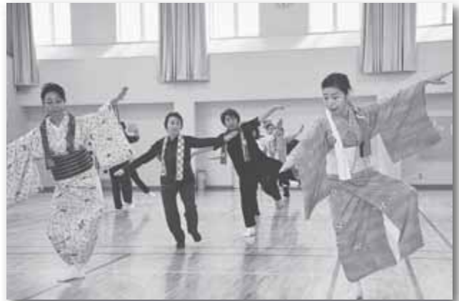
かっぼれ教室 5/12 太平百合が原地区センター