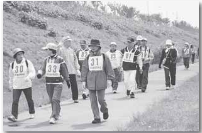
新川さくら並木ウォーキング 5/10 新川3-16付近