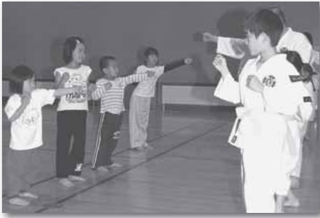
子ども少林寺体験教室 5/12 篠路コミュニティセンター