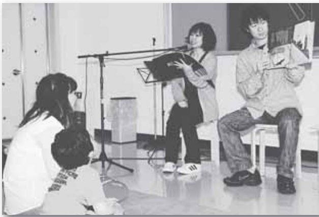
親子で楽しむ朗読 5/16 新琴似図書館