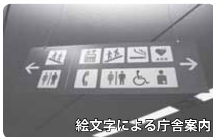
絵文字による庁舎案内

文字の種類や大きさ、表示内容・色などを統一し、誰にとっても分かりやすい窓口表示となりました。 今回のリニューアルは、札幌市立大学と障がい者小規模作業所の協力を得て、問題を検証し、デザインの企画、製作を行いました。 色覚障がいのある方に配慮した色使い、地図や絵文字を活用した庁舎案内の設置など、分かりやすさを向上させる工夫をしています。 これからも、区民の皆さんの立場に立ち、誰もが利用しやすい区役所に向けた取り組みを進めていきます。