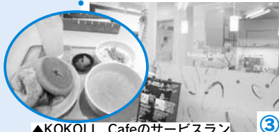
▲KOKOLI CafeのサービスランチAセット。この日は手ごねパンとスープがメインでした。