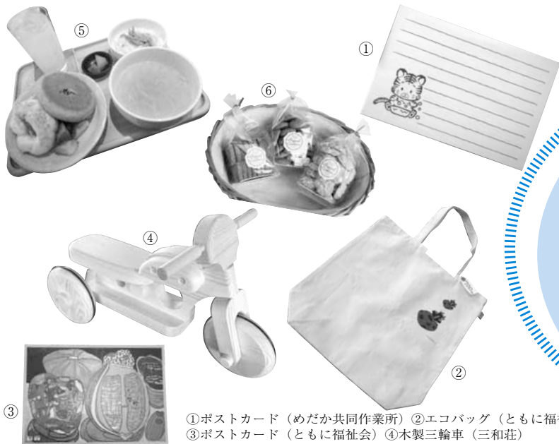
①ポストカード（めだか共同作業所）②エコバッグ（ともに福祉会） ③ポストカード（ともに福祉会）④木製三輪車（三和荘） ⑤サービスランチAセット（KOKOLI Cafe）⑥クッキー（三和荘）

障がいのある方が生き生きと作業や活動をしている「地域活動支援センター」や「地域共同作業所」などの障がい者福祉施設。西区には約30カ所あり、約650の方が区内外から通い、心のこもった商品の製造や販売をしています。