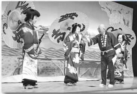
新琴似歌舞伎中学生公開講座での中学生着付け体験の様子