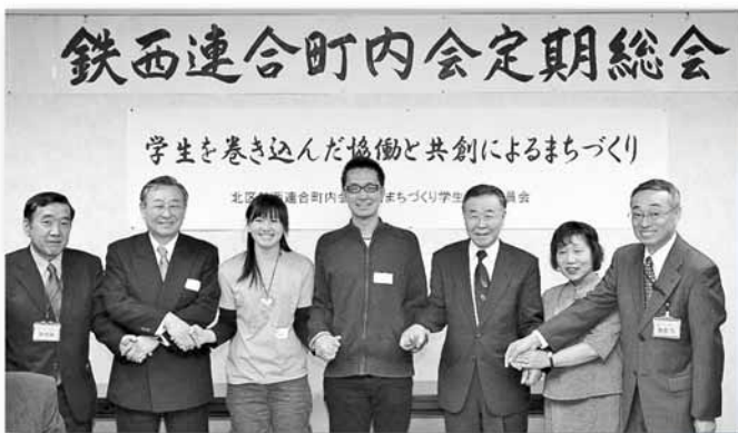
鉄西連合町内会定期総会で同会青年部となった鉄西まちづくり学生推進委員会

HP http://www.city.sapporo.jp/kitaku/ 北区総務企画課庶務係 ☎ 北区役所内線 212