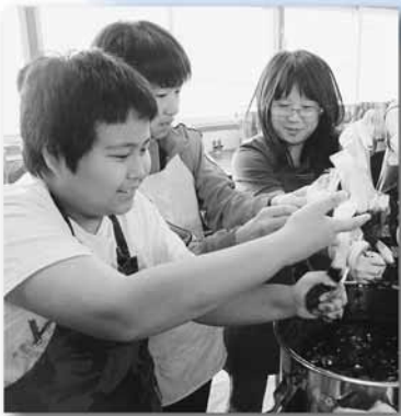
篠路西小学校で行われた藍染め体験教室

北区では、こうした伝承活動に対し、活動資金の助成やPR活動などの支援を行いました。こうした活動が続けられていくことが、愛着の持てるまちづくりにつながることから、今後も支援を続けます。