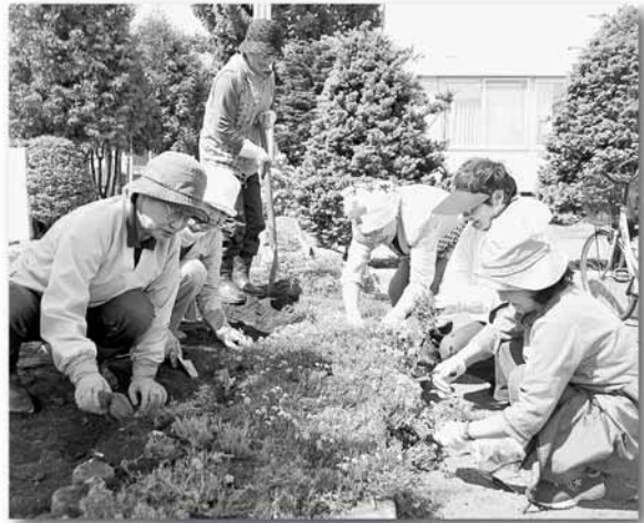
太平百合が原まちづくりセンター前での花壇づくり

北区には、地域を花で飾る活動をしている団体が数多くあり、この1年間、地区会館の花壇や歩道の街路升など、さまざまな場所への花植え活動が行われました。