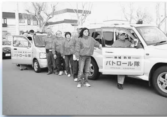
新琴似西地区防犯パトロール隊の皆さん