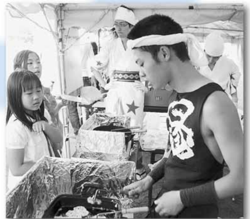
学生が参加した「幌北ふるさと夏まつり」

鉄西地区では、昨年4月に北海道大学の学生を中心とした「鉄西まちづくり学生推進委員会」が連合町内会の青年部として正式加入し、地域行事の企画・運営などに参加しました。また、幌北地区でも、学生が中心となって地域を紹介する冊子を作ったり、夏祭りに参加したりするなど、学生と地域とが力を合わせてまちづくり活動を行っています。 北区では、大学が多く学生が数多く住むという特性を活かし、助成金の交付や、まちづくりセンターを中心として学生と地域住民のコーディネートを行うなどの支援を行いました。今後も、学生と地域が一体となったまちづくり活動のお手伝いをしていきます。