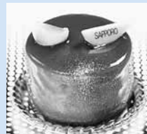
↑ さっぽろハスカップフロマージュ

「さっぽろスイーツ」を都心部から発信する、新たなカフェの設置・運営を支援。市内のさまざまな洋菓子店のケーキを楽しめます。