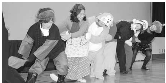
▲子育てサークル& 子育てボランティア交流会(2/9) 楽しい仲間たちと、力を合わせてカブを 抜きましょう。