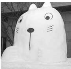
◀雪像作り(2/7) 区役所前に、ねりんピック北 海道・札幌2009のキャラクター 「うっさん」の雪像が登場。