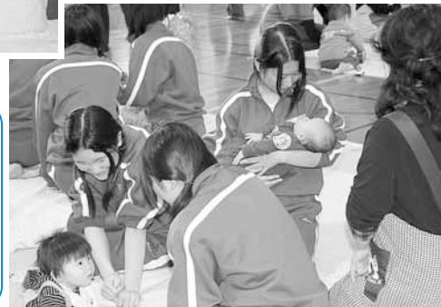
▶中学生の 子育てサロン (2/10・12) 中学生が子 育て体験。 子どもたち も大喜び。