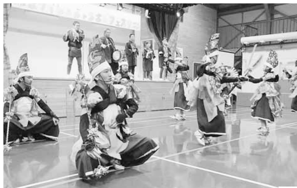
▲ホワイトジャンボフェスタ(1/25) イベントを盛り上げる、七頭舞の勇壮な演舞。