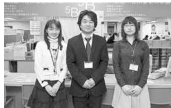
▲保険年金課の職員

手続きの際にはお持ちいただくものがありますので、南区版7ページをご覧ください。また、例年4月1日から数日間は非常に混雑しており、手続きに時間がかかる場合があります。ご了承ください。