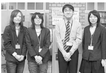
▲戸籍住民課の職員

3・4月は窓口が大変込み合うことから、3月30日~4月3日と4月6日は窓口を午後7時まで延長します。なお、証明は大通証明サービスコーナー(地下鉄南北線大通駅構内 ☎211-3535)でも請求できます。