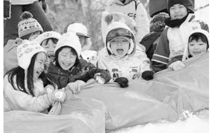
一番人気は、ダイナミックなビニール滑り!!