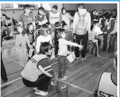
室内でも、楽しい遊びのコーナーがいっぱい!!