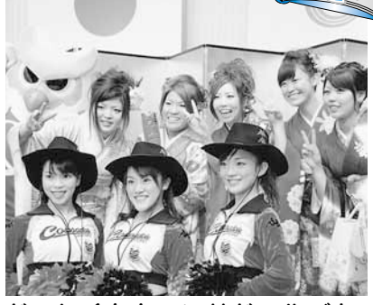
ドールズとコンサドルズも、お祝いに駆け付けたよ!!