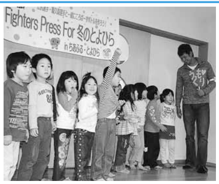
ファイターズ選手の一日記者体験 (12/8) 子どもたちとの交流も、楽しみました。