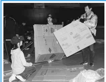
冬の災害避難所体験 (1/11・12) ダンボールを使って防寒対策。