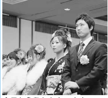
今日から私たちも、大人の仲間入りをします。