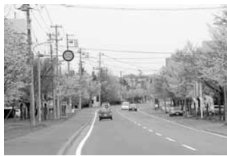
▲旧国道 36 号の桜並木

清田区では旧国道36号の広い歩道ゾーンや桜並木などの地域資源を積極的に活用して、区民が親しみを感じ、利用しやすい歩行空間の実現を目指す「やすらぎ歩行空間プラン」を策定します。