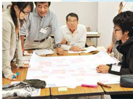
企画会議を立ち上げ、各プロジェクトチームに分かれて検討を進めています。

北海道情報大学と 北星学園大学の学生が 参加し、地域の人と 一緒に祭りをつくる!