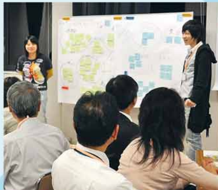
※このページは、『新さっぽろ冬まつり』の広報活動の一環として、広報プロジェクトの学生が企画制作しています。