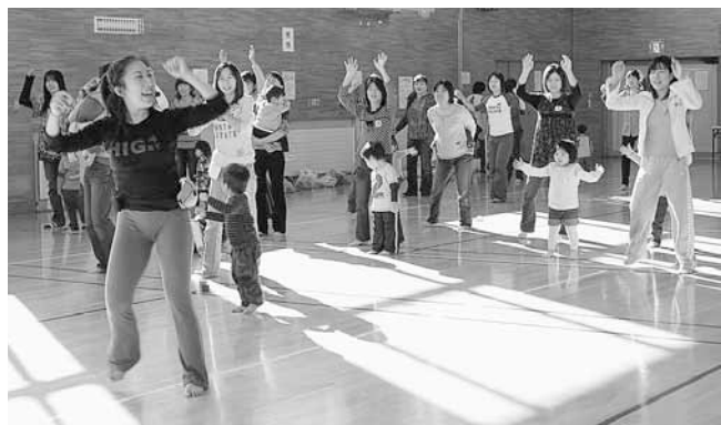
▲リズムに乗ってダイエット

スポーツインストラクターを講師に迎え、日ごろ子育てで忙しいお母さんたちに、リフレッシュしてもらおうと、ちあふる・ていね（手稲区保育・子育て支援センター）主催の「ちあふる・ていねでエクササイズ」が手稲コミュニティセンターで行われました。