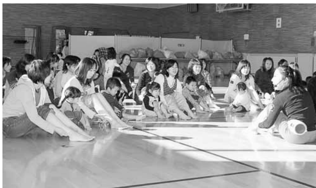
▲家で簡単にできる足のリンパマッサージ