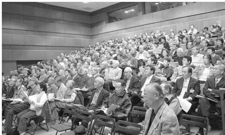
▲講演に耳を傾ける参加者たち