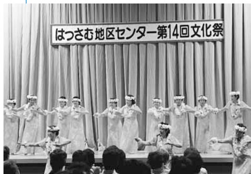
▲舞台発表の様子(はっさむ地区センター)

会場では、繊細な手芸作品や色鮮やかな絵画などの展示、フラダンス・日本舞踊などの舞台発表が行われ、それぞれのサークルが日ごろの活動の成果を披露しました。