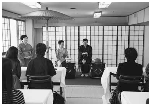
▲お茶席の様子(西区民センター)