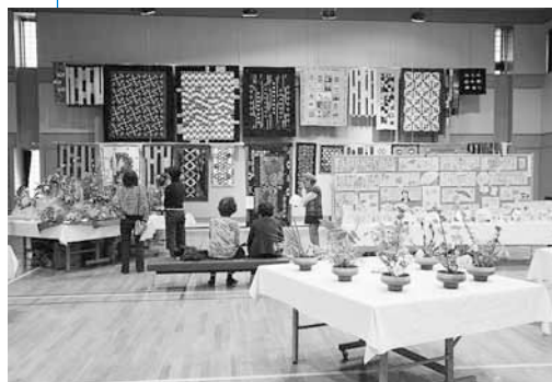
▲パッチワークなどの作品展示(西野地区センター)

会場入り口などには募金箱が置かれ、訪れた多くの方が募金に協力して、赤い羽根を襟元に着けていました。