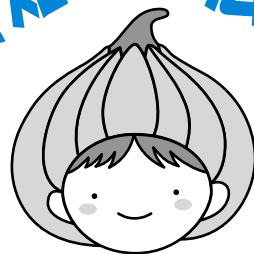
東区マスコットキャラクター「タッピー」