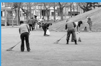
↑ 春にはみんなで清掃します