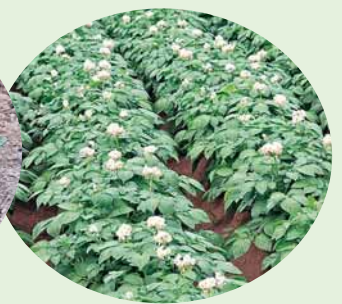
ジャガイモには花が!