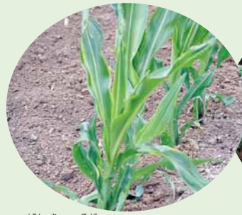
元気に育つトウモロコシ♪