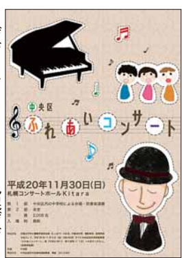
▶デザイン イラスト…札幌デザイナー学院 矢鳥さやかさんの作品