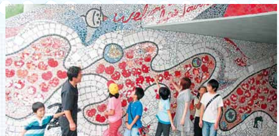
▲完成したしらかばトンネルモザイクアート

トンネルに自分たちで貼ったタイルが永遠に作品として残るのです。素晴らしい思い出になりますね」と話します。