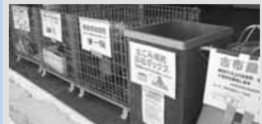
回収品目ごとにボックスを設置

使い終わった食用油や蛍光灯、衣類などの布製品などはありませんか? 資源として再利用しますので、ぜひお持ちください。