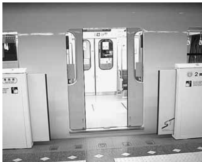
列車のドアと同時に柵が開閉します