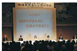
↑昨年11月に開催した「地球を守るための行動ができること」シンポジウム