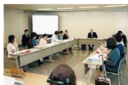
↑8か月にわたり議論を交わしてきた市民会議

今回の宣言に当たり、市は市民会議を設置して、平成19年10月から宣言の内容などについて検討を行ってきました。また、シンポジウムでのアンケートやパブリックコメントなどを通して、多くの市民意見を取り入れました。