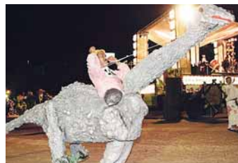
昨年は恐竜の仮装で見事コンクールに優勝!

夏まつりの盆踊りには、22年前から仲間と一緒に毎年参加し、若者向けに独自にアレンジした踊りを踊っています。わたしたちと一緒に踊るのを楽しみにしてくれる人もいるので、参加者が減っている盆踊りを盛り上げるためにも、続けていきたいですね。今年も最終日の仮装では優勝を狙います。ぜひ見に来てくださいね。