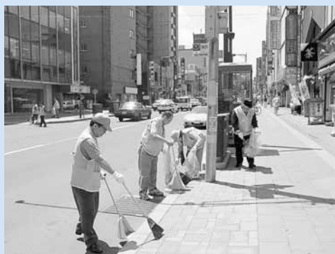
▲北海道で最初に始まった、琴似商店街振興組合のアダプト・プログラム活動

町内会など地域の皆さんが「ヤマメの稚魚放流」や「琴似発寒川の一斉清掃」などに長年にわたり取り組んでいます。また「アダプト・プログラム（まちの美化・清掃活動）」には、商店街や企業なども参加し、ごみのない美しいまちづくりを進めています。