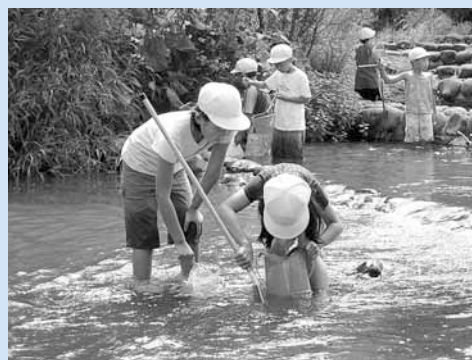
▲左股川での水生生物観察会ではいろいろな生き物を見つけました。

次世代の担い手となる子どもたち向けに「水生生物観察会」などさまざまな環境活動を実施しています。これらの活動成果は「こども環境活動発表会」で披露され、環境を考えるきっかけになるとともに、子どもたちの交流の場にもなっています。