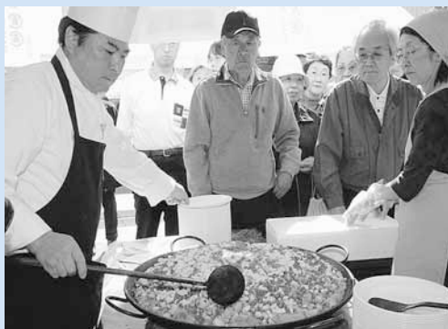
▲昨年行われた美味しいエコフェスタの試食コーナーの様子