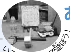
いろいろなおもちゃで遊ぼう！

オセロや手作りのスマートボールなどおもちゃがたくさん！地域のボランティアの方が教えてくれるけん玉などの昔遊びもやってみよう。