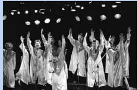
▲2月に行われた西区文化フェスタの様子