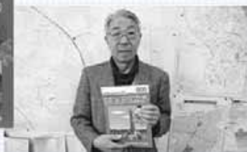
▲子どもからお年寄りまで読みやすいように、字が大きく、内容が簡潔にまとまっている。