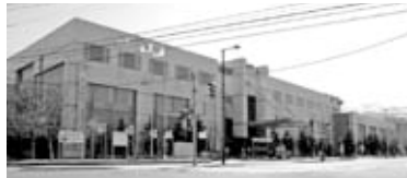
▲区役所・区民センター・保健センターが一つの建物になっています

住所：前田1条11丁目 電話：681-2400(代表) 開庁日：月曜日～金曜日(祝日を除く) 業務時間：午前8時45分～午後5時15分 交通：JR手稲駅北口から徒歩5分 (連絡通路でつながっています)