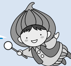
東区のマスコットキャラクター タマネギの妖精「タッピー」

東区にはいろいろな施設があるんだ。 スポーツで汗を流すのもいいし、子どもたちと遊んだり、学んだりするのもいいね。 使わないと損だよな。