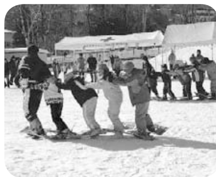
▲南円山雪中運動会（南円山地区）

自分たちの住んでいる地域をきれいな住みよいまちにしたい、みんなが安心して暮らせる地域にしたい。誰もが思うのかもしれない。そう思うのと同じように、近隣の住民同士が会員となって活動する団体が町内会です。