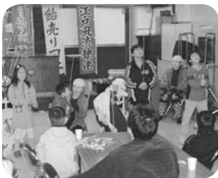
▲新春子どもお楽しみ会（東北地区）