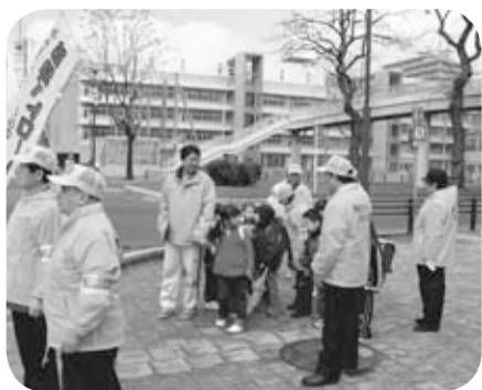
▲西創成親和会防犯パトロール隊（西創成地区）