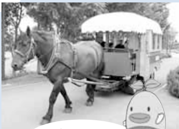
公式キャラクター「ぐんぐん」

農作物の栽培・収穫や動物とのふれあいが楽しめる施設です。4月29日(祝)からは夏期営業が始まり、SLバス、馬車、パークゴルフ場、炊事広場などすべての施設が利用できます。