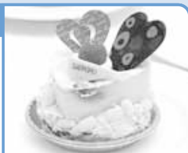
今年のさっぽろスイーツに選ばれた「サミットさっぽろプリンパイ」

近隣の製菓店が、道産素材を使用した「さっぽろスイーツ」の新作を販売するほか、牛乳パックを使った紙作り教室など、子供向けのイベントも満載です。また、交流館では、近郊農業者がキャベツやニンジンなどの越冬野菜、花苗、農産加工品を販売する「さとのいち」を開催します。