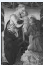
ポッティチェリ「聖母子と天使」(1467年~70年) →

ナポレオンの叔父ジョゼフ・フェッシュ枢機卿が集めたイタリア美術コレクションから、61点を厳選し、日本で初めて公開します。