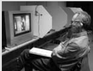
↑まずは札幌国際短編映画祭の応募作品を中心に市場を開設します

企業や大学と連携して、短編映画などの作品を売り買いする市場をインターネット上に創設。今年の短編映画祭に合わせて開設し、その後内容を充実させていきます。