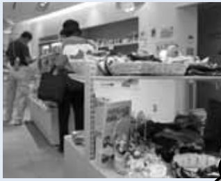
↑大盛況の元気ショップ1号店

市内の小規模作業所などで作った商品販売している元気ショップ。1号店の好評を受け、利用者の声などを踏まえながら、2号店開設に向けた調査を行います。