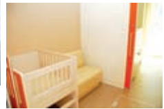
▶授乳室と小児トイレも