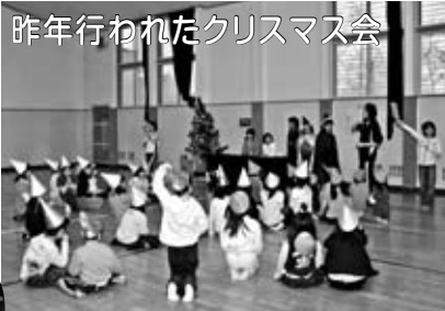
昨年行われたクリスマス会