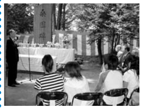
▲桑園開拓まつりの様子

桑園地区は、南北は北一、北二十二条、東西は西八、西二十一丁目までのかなり広い地域で、マンションの建設などにより、市内有数の人口急増地域になっていきます。地区には、市立大学や市立病院、知事公館、植物園、競馬場などさまざまな施設があることも特色です。まちづくり活動は連合町内会を中心に行われており、運動会や文化祭など数多くの行事を実施し、地域内の交流を図っています。 また、明治八年に旧庄内藩士により開墾され、桑苗四万株が植栽され、「桑園」という地名の由来になったという歴史を持ち、昨年八月には、先人への感謝と顕彰および次世代への歴史の継承を図るため、「桑園開拓まつり」を三年ぶりに開催しました。これらの活動のほかにも、子どもを見守る活動や防火パトロールなど防火・防犯活動