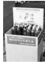
砂入り ペットボトル

区役所、市役所などでは、ペットボトル入りの持ち運びしやすい砂を無料で配布しています。また、歩道に設置された砂箱の砂も自由に取り出して使用できます。みんなで砂をまいて、事故を防止しましょう。