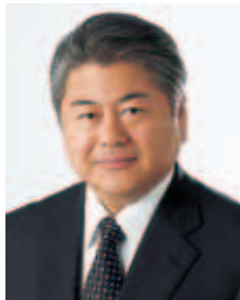
札幌市長 うえだ ふみ お 上田 文雄

札幌市総務局広報部広報課 〒060-8611 中央区北1西2 ☎211-2036 FAX218-5161 Eメール kohokakari@city.sapporo.jp