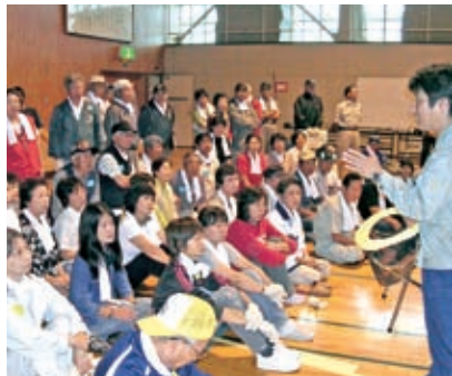
▲訓練でも全員真剣な表情です