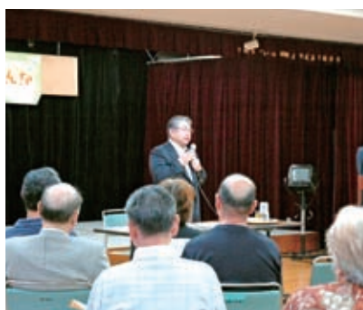
▲上田市長と意見交換を行いました