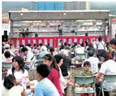
▲ふれあい祭りの会場

今年も地域の人が「世代を超えて、より多くの人たちが参加できる」事業へと変えていくことを目指して、同まちづくり協議会が開催しました。お祭り当日は、地域に住んでいる人・地域にある北海道工業大学の学生・地元の小学生など多くの人たちが参加し、盛り上げました。